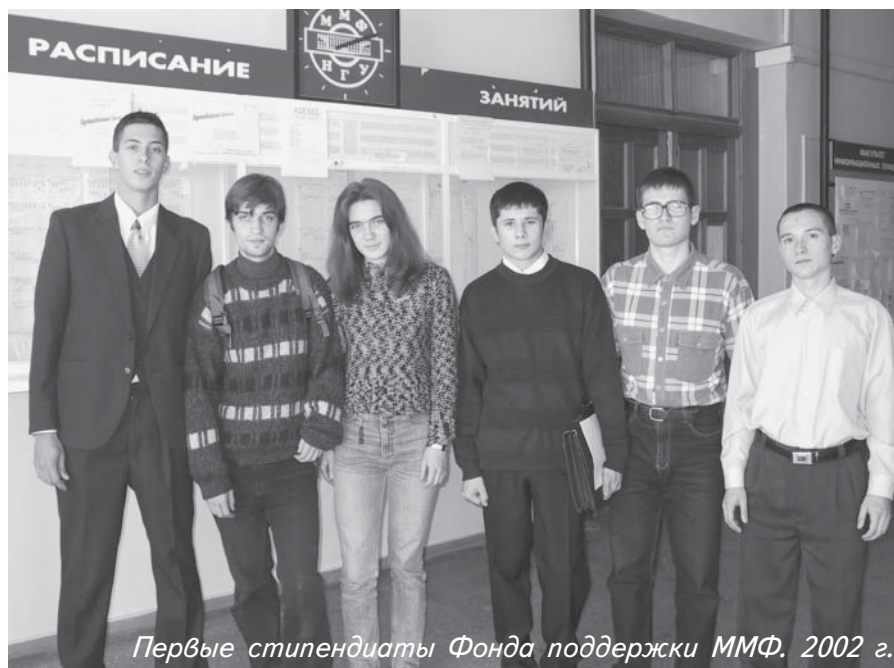
Первые стипендиаты Фонда поддержки ММФ. 2002 г.

Двадцать девятого марта открылся сайт медицинского факультета НГУ.