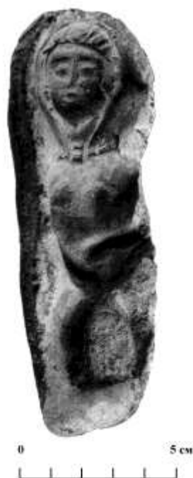
Рис. 3 (фото). Матрица (кальп) для изготовления женских терракотовых фигурок из поселения Арапхана (из материалов раскопок А. А. Бурханова)

В научной литературе аналогичные типы мужской скульптуры известны как «идольчик» или «всадник-уродец». Арапханская статуэтка «всадника», возможно, некогда посаженная на конька, выполнена грубо,