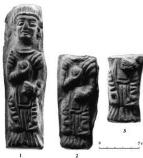
Рис. 2 (фото). Терракотовые фигурки богини плодородия из поселения Арахана (из материалов раскопок А. А. Бурханова)

проработанную фигурку женщины в длинном одеянии (рис. 2, 1).