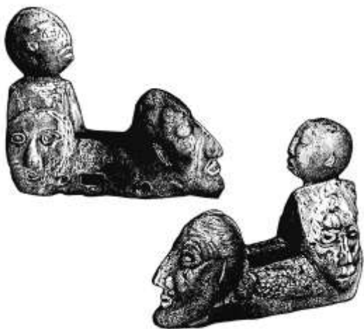
Рис. 3. Бронзовый предмет с изображениями человеческих лиц из Дахуачжун (по: [Ковалев, 2001. С. 163, рис. 2, 5, 6]; без масштаба)

Однако мы не знаем, где изображены собственно «каяосцы», а где их соседи. Судя по предпринятому нами обзору основных параметров культуры каяо (равно как и рассмотренной ранее культуры сыба), в