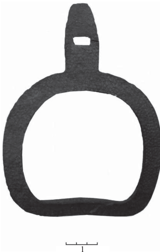
Рис. 1 (фото). Стремя (сторона с орнаментом) из Кяхтинского музея (железо)

В генеалогических и исторических легендах бурят сохранились, очевидно, уходящие в древность, воспоминания о связях с корейцами. Приведем одно из них. Некогда в Монголии жил Хун-Тайжи хан. У него было четыре сына: от Барга-батара произошли якуты, от Шоно-батара – корейцы, от Сэрэн-Галдана – Булгад, от Хореодой убгуна – племена хори и шарайд [23. С. 173]. По этой легенде получается, что буряты и корейцы имеют общего отца-прародителя. О корейцах упоминается и в повествовании о Бальжин хатан – жена Бубэй бэйлэ была дочерью Гулин хана – корейского хана [Там же. С. 183]. Следует отметить, что в легенде Бубэй бэйлэ часто называют солонгутским князем. Буряты под именем солонгуты по-