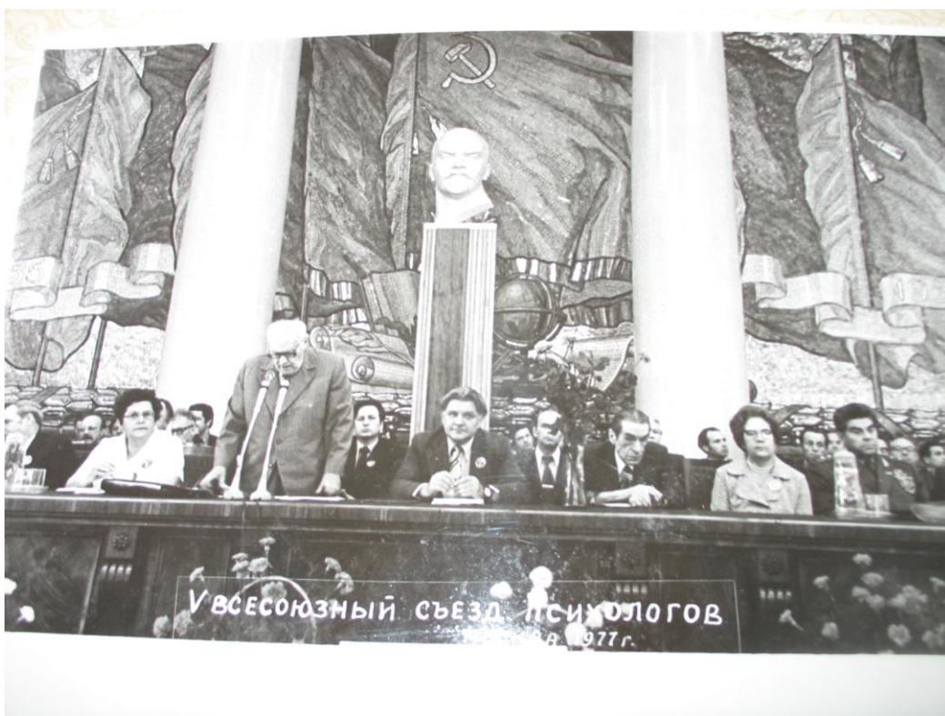
Фото 1. Пленарное заседание на V Всесоюзном съезде психологов. Москва, 1977 г.