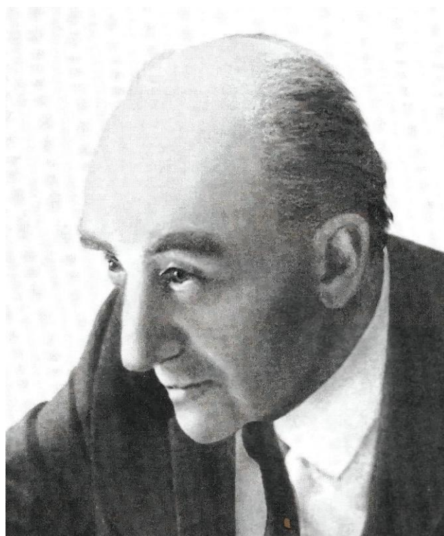
Фото 5. Б. Г. Ананьев – лидер ленинградской психологической школы (фото 1960-х гг.)