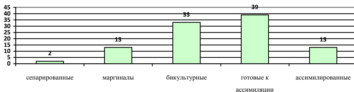
Рис. 1. Распределение мигрантов по уровню ассимилированности, %